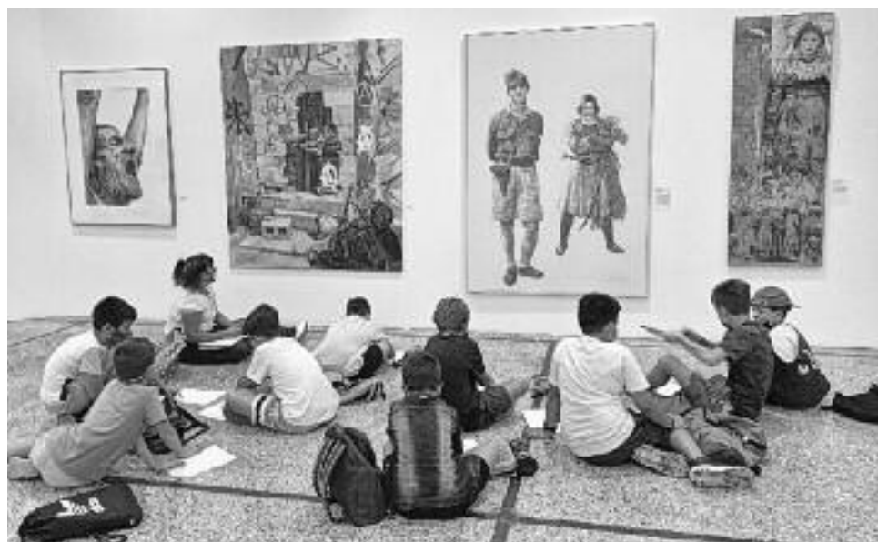
Από τις εκθέσεις του ΕΕΤΕ