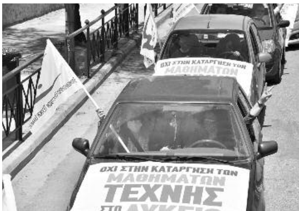
Από κινητοποιήσεις του ΕΕΤΕ