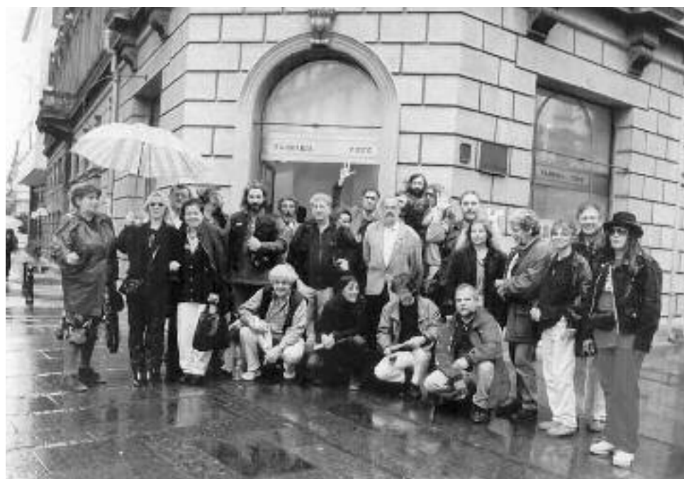
Αποστολή του ΕΕΤΕ στο Βελιγράδι, Απρίλης 1999.