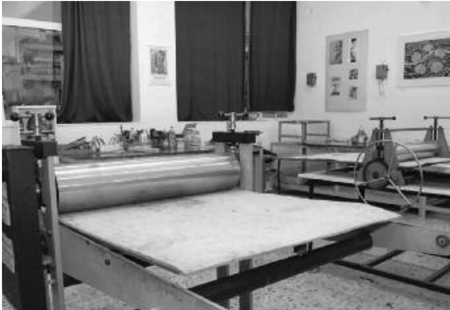
Το Ανοιχτό Εργαστήριο Χαρακτικής του Δήμου Νίκαιας