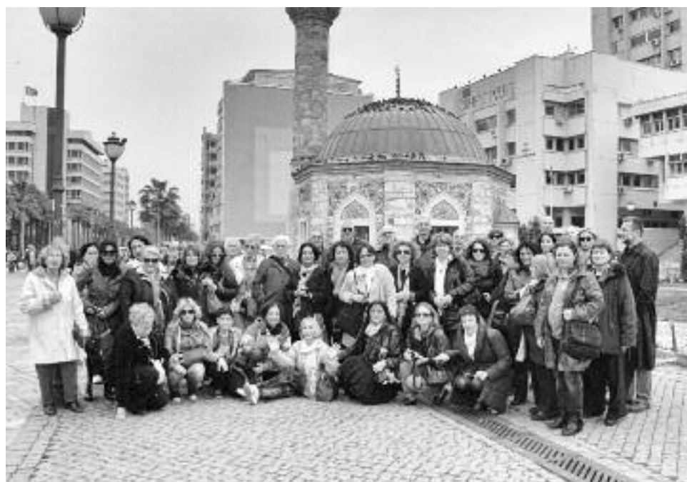
Από τις εκδρομές του ΕΕΤΕ