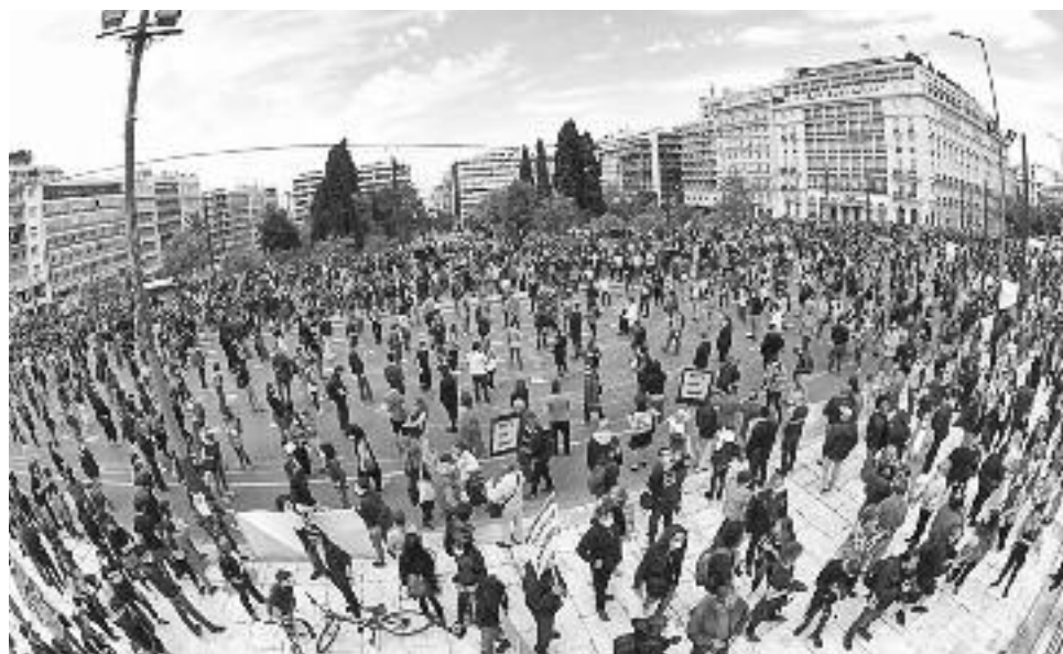
Παναλλιτεχνική κινητοποίηση, 7/5/2020