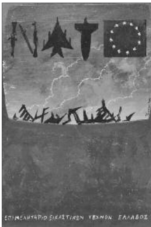
Εξώφυλλα καταλόγων εκθέσεων και αφίσες που εξέδωσε το ΕΕΤΕ